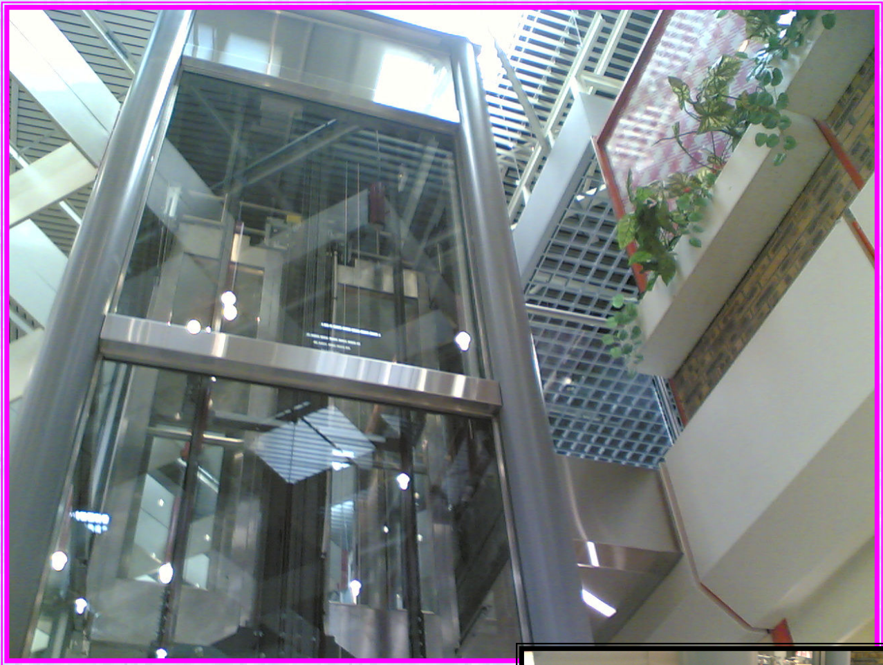
Garde corps de protection en partie basse Ø 50mm ép 3 mm fixations invisibles